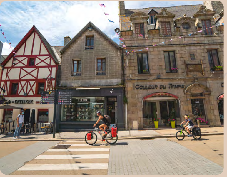
Saint Pol de Léon